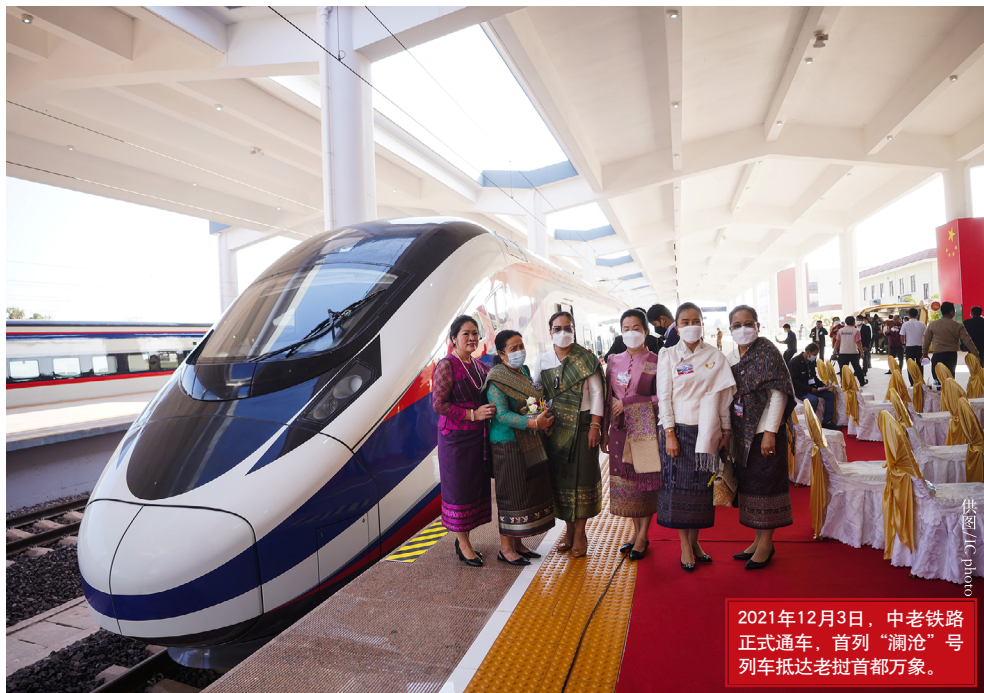
2021年12月3日，中老铁路正式通车，首列“澜沧”号列车抵达老挝首都万象。

“中老铁路”开通后，老挝农业迎来大发展。老挝工贸部主办的“老挝贸易网”报道称，“中老铁路”的开通为老挝农产品生产和出口创造了巨大机会，老挝产的木薯粉今年上半年出口值达2.5亿美元，成为老头号出口农产品，“中老铁路”功不可没。老挝《万象时报》报道，老政府正努力加强通过“中老铁路”的对华货物出口，力争使该国在2022年的对华贸易顺差能比上年增加55%，达到15.5亿美元。